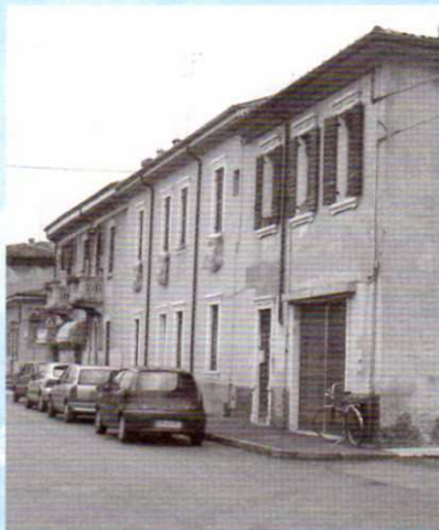
La nuova sede AdB, in via Spagna 6

I soci più "antichi" ricorderanno che via Spagna è già stato l'indirizzo degli AdB dal 1988 al 1996, quando l'associazione risiedeva all'interno della Casa per la Nonviolenza, al numero 8. La nuova sede è molto più grande e confortevole: potremo offrire più servizi. Ma è anche finanziariamente più impegnativa. Il comune di Verona non aveva sedi idonee da assegnarci; siamo quindi ricorsi a una sistemazione in affitto a prezzi di mercato che ci espone economicamente. Il trasferimento è stato deciso all'unanimità, tutti d'accordo sulla necessità di non strozzare la crescita rimanendo in una sede troppo piccola e di scommettere invece sul successo che l'associazione sta registrando.