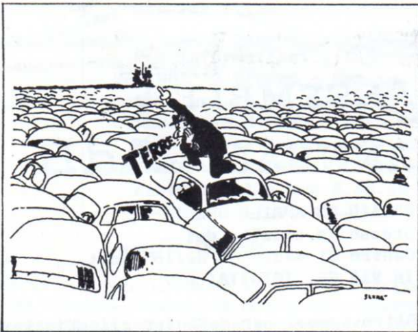
«les droits du piéton», paris

Ore 20.30 (sala monsignor Chiot, San Luca),