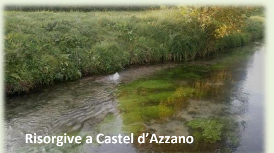
Risorgive a Castel d'Azzano