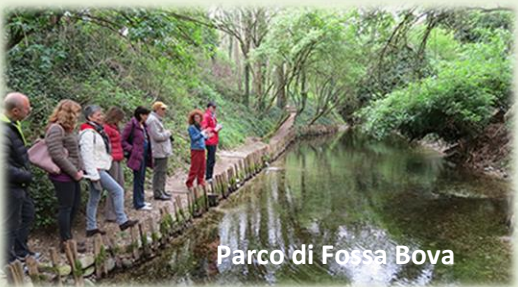
Parco di Fossa Bova