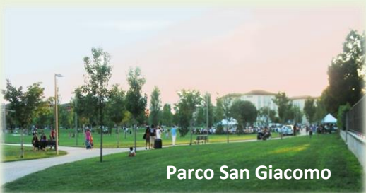
Parco San Giacomo