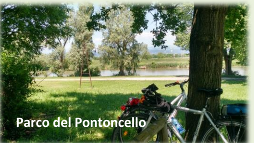
Parco del Pontoncello